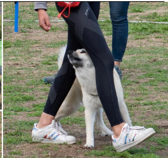
Femkamp – en av øvelsene