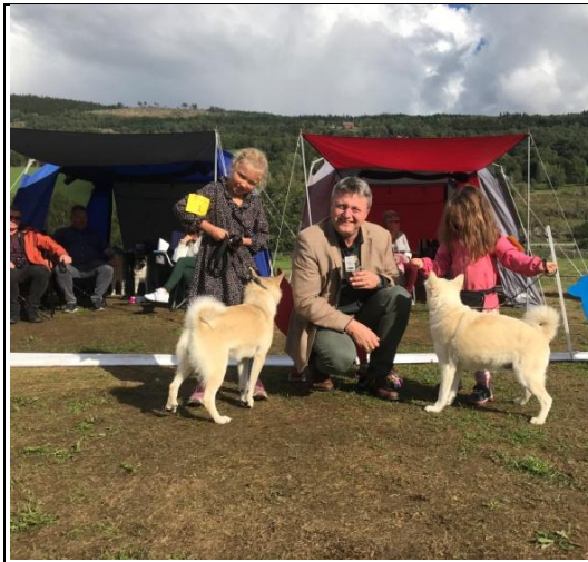
Barn og Hund – Nasjonaldagen 2018

23-25. august 2019 på Hunderfossen Camping