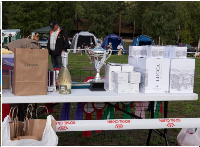
Alltid fine premier

Nå nærmer vi oss nok en gang årets høydepunkt for oss buhundentusiaster - Buhundens nasjonaldag. Stedet er Hunderfossen Camping ved Lillehammer, datoen er 23-25. august. På programmet har vi som vanlig Valpeshow, Offisiell utstilling, Barn og Hund, kåring av Årets buhund, utstillingens Beste svarte - Vi skal kåre Vakreste hode og Flotteste hale, og selvfølgelig skal vi se hvem av de firebeinte som er raskets på 60 m. I tillegg skal vi ha 5-kamp. Og innimellom dette skal vi snakke sammen, hygge oss og beundre hverandres hunder. Vi har tradisjonen tro kiosk der vi serverer enkel mat og drikke, og det blir loddsalg. Vi tar imot premier til loddsalget med takk. Vi håper naturligvis at sola skinner og bidrar til å gjøre dagen minnerik. Alle er velkommen til Hunderfossen. Du trenger ikke stille ut hund for å komme.