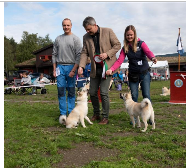
Den skal tidlig krøkes – BIR og BIM valp 2018

For å få arrangementet til å gå knirkefritt er vi avhengig av litt hjelp fra våre medlemmer. Kunne du tenke deg å hjelpe til? Send oss en epost til styret@buhundklubben.no Vi ønsker alle hjertelig velkommen!