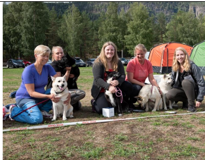
Femkamp – vinnerlagene 2018

Nå nærmer vi oss nok en gang årets høydepunkt for oss buhundentusiaster - Buhundens nasjonaldag. Stedet er Hunderfossen Camping ved Lillehammer, datoen er 23-25. august. På programmet har vi som vanlig Valpeshow, Offisiell utstilling, Barn og Hund, kåring av Årets buhund, utstillingens Beste svarte - Vi skal kåre Vakreste hode og Flotteste hale, og selvfølgelig skal vi se hvem av de firebeinte som er raskets på 60 m. I tillegg skal vi ha 5-kamp. Og innimellom dette skal vi snakke sammen, hygge oss og beundre hverandres hunder. Vi har tradisjonen tro kiosk der vi serverer enkel mat og drikke, og det blir loddsalg. Vi tar imot premier til loddsalget med takk. Vi håper naturligvis at sola skinner og bidrar til å gjøre dagen minnerik. Alle er velkommen til Hunderfossen. Du trenger ikke stille ut hund for å komme.